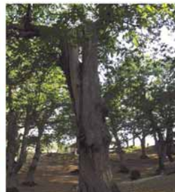
Le immagini possono essere rievocate da chi le ha scattate